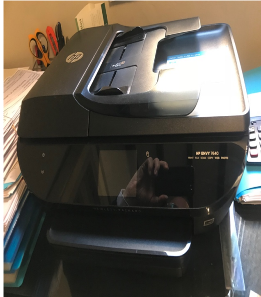
Impresora HP ENVY 7640