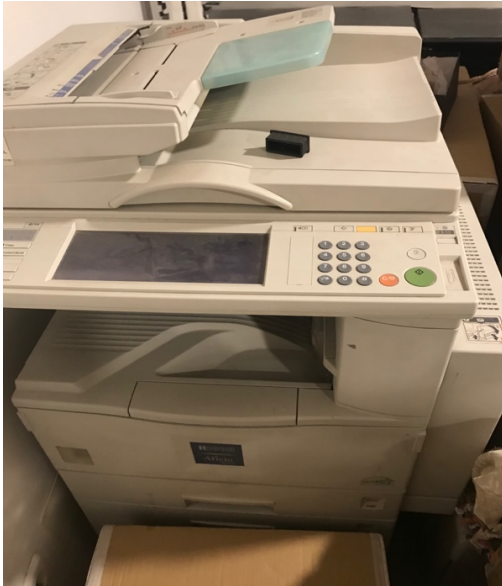
Fotocopiadora Ricoh Aficio 2022