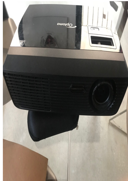
Proyector Digital Optoma DS316L