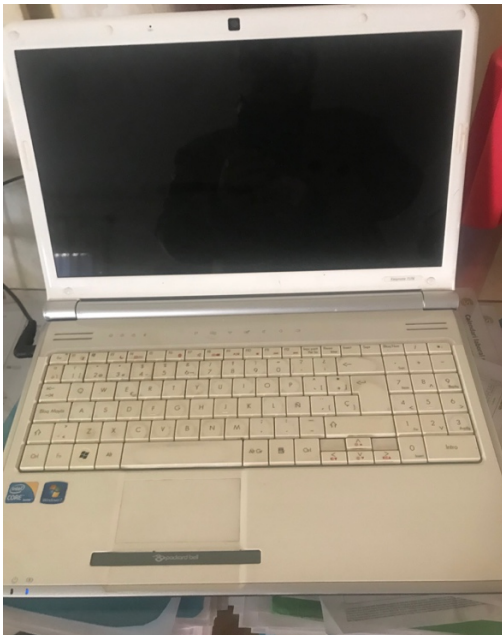
Ordenador Portátil Packard Bell easynote TJ76